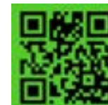
Mapa de Setúbal

O acesso ao Campus do IPS é facilitado pelas autoestradas A2, A12 e pela N10 e pelas Pontes 25 de Abril ou Vasco da Gama. O comboio e o autocarro constituem-se como transportes por excelência, uma vez que a acessibilidade é muito boa. A sua localização, a cerca de 50 Kms de Lisboa, num local calmo, em pleno Estuário do Sado, próximo da Serra da Arrábida e de toda a região da Costa Azul, constituem um grande privilégio.