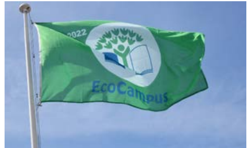
O hastear da bandeira Bandeira Eco Campus na ESS/IPS em abril de 2023